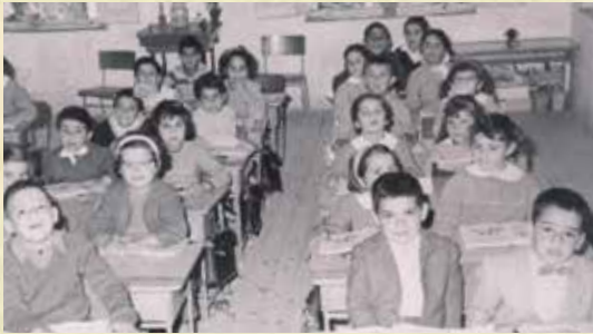
Μαθητές του Δημοτικού Σχολείου Αγίου Ανδρονίκου εν ώρα μαθήματος.

06 Ευτύχιος, Ευτυχία 15 Λεωνίδας 22 Νέαρχος 24 Λάζαρος 25 Βάιος, Βάγια