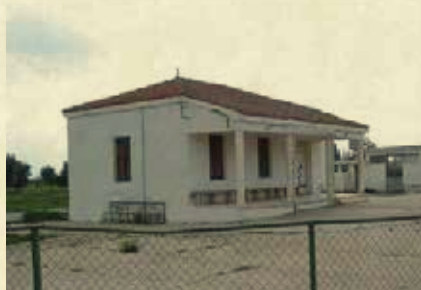
Δημοτικό Σχολείο Χρυσίδας