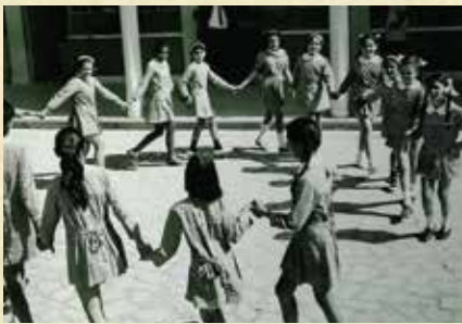
Μάθημα χορού στο προαύλιο του Δημοτικού Σχολείου Αγίου Ανδρονίκου .