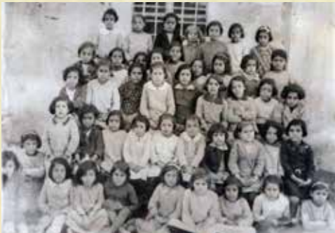
1937 - Μαθήτριες του Παρθεναγωγείου Αγίας Μαρίας.