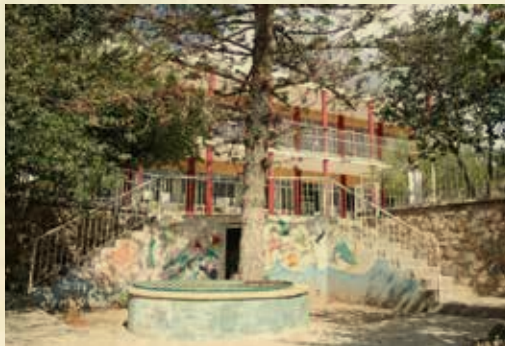
Δημοτικό Σχολείο των Άνω Ενοριών (Χαρδακιώτισσας)