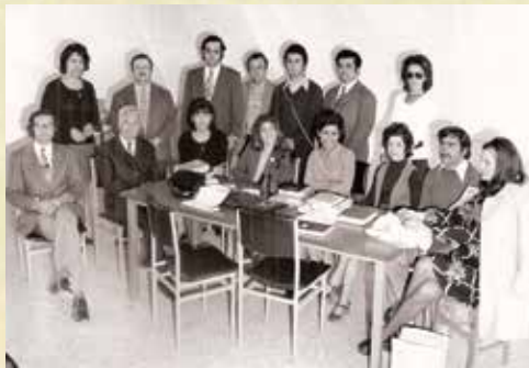
1973 - Καθηγητές του Γυμνασίου Κυθρέας .