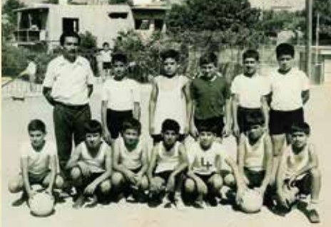
Μαθητές του Δημοτικού Σχολείου Χαρδακιώτισσας , έτοιμοι για αγώνα ποδοσφαίρου.