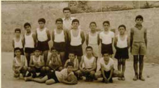
Αθλοπαιδιές στο γήπεδο του Δημοτικού Σχολείου Χαρδακιώτισσας.