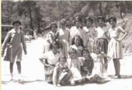
1957 - Εκδρομή του Δημοτικού Σχολείου Αγίου Ανδρονίκου στη Χαλεύκα.