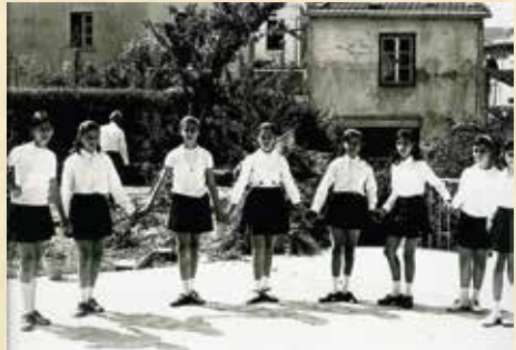
Χοροί σε σχολική γιορτή από μαθήτριες του Δημοτικού Σχολείου Χαρδακιώτισσας .