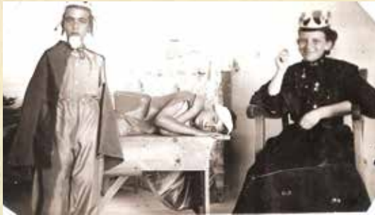
Σκηνή από θεατρική παράσταση στο Δημοτικό Σχολείο Αγίου Ανδρονίκου.