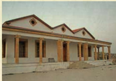
Δημοτικό Σχολείο Αγίου Ανδρονίκου (Τούμπας)