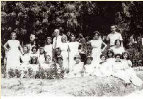
Καλλιτεχνικές επιδείξεις στον κήπο του Δημοτικού Σχολείου Αγίου Ανδρονίκου.