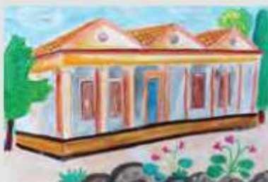
Γ' Βραβείο: Χριστίνα Κυπριανού Καραολιά Μαθήτρια Στ' τάξης Περιφερειακού Δημοτικού Σχολείου Ταρσασού «Το σχολείο που περιμένει»