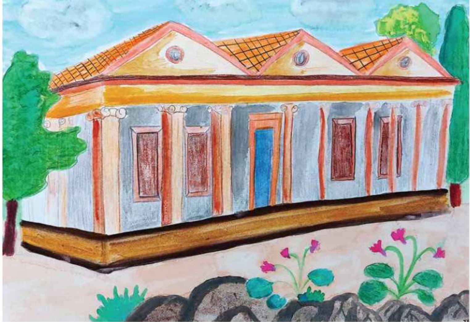
Χριστίνα Κυπριανού Καραολιά, Μαθήτρια Στ' τάξης Περιφερειακού Δημοτικού Σχολείου Ταμσσού, «Το σχολείο που περιμένει».