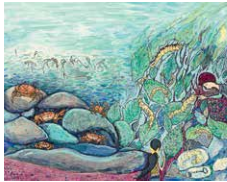
Το κείμενο του λευκώματος έγραψε η Χρυσόθεμις Παπακωνσταντίνου και η εικονογράφηση έγινε από τη Χριστίνα Καρεκλά

Αξιοζήλευτες για τα σημερινά παιδιά, ιδίως των πόλεων, οι σκηνές κοντά στη φύση, όπως εκτυλίσσονται μέσα από τα κειμενικά και εικαστικά συμφραζόμενα. Σε διττή αναπαράσταση τα Κυθρεόπουλα στις απογευματινές παιγνιώδεις εξορμήσεις τους, μετά το σχολείο, για να κυνηγήσουν με τα καλάμια και τις αυτοσχέδιες απόχες καβούρια κάτω από τις κροκάλες του ποταμού και έξω από τις παραποτάμιες καβουρότρυπες. Αλλά και την άνοιξη να μαζεύουν φύλλα συκαμιάς, για να ταΐσουν το καματερό, που τους αντάμειβε με το πολύτιμο μετάξι. Διακριτές οι