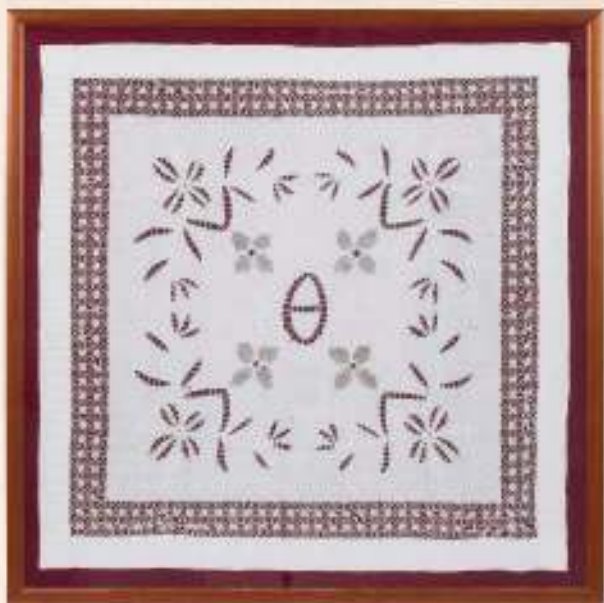
ΚΕΝΤΗΜΑ ΚΟΦΤΟ ΜΕ ΓΑΖΙΑ, έργο της Θέκλας Πανταζή Λουκά από την ενορία Χαρδασκιάτισσας. (Συλλογή Ιωάννη Ηλιάδη)