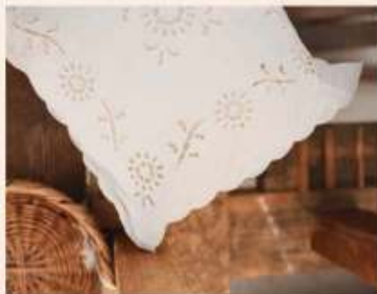
ΜΑΞΙΛΑΡΘΗΚΗ ΜΕ ΚΕΝΤΗΜΑ ΚΟΠΤΟ, έργο της Ιουλίας Αρτεμίου από την ενορία Αγίας Μαρίας.