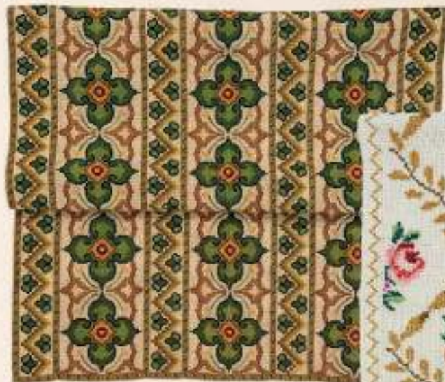
ΚΕΝΤΗΜΑ ΣΕΜΕΝ ΣΤΑΥΡΟΒΕΛΟΝΙΑ, έργο της Ανθής Πέτσα Σαββίδου από την ενορία Αγίας Μαρίας.