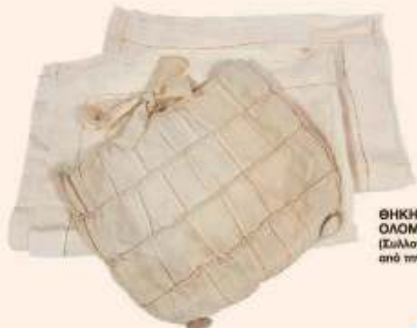
ΘΗΚΗ ΜΕ ΔΥΟ ΟΛΟΜΕΤΑΞΑ ΣΕΝΤΟΝΙΑ (Συλλογή Ειρήνης Χατζηδημητρίου από την κοινότητα Αγίας Μαρίας)