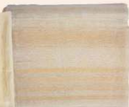
ΣΕΝΤΟΝΙ ΜΕΤΑΞΕΣΤΟ Έργο Χρυστάλλου Κούλα από τη Χαρθακάισσα.