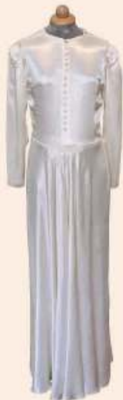
ΝΥΦΙΚΟ ΜΕΤΑΞΩΤΟ ΦΟΡΕΜΑ ΜΕ ΚΟΥΜΠΙΑ