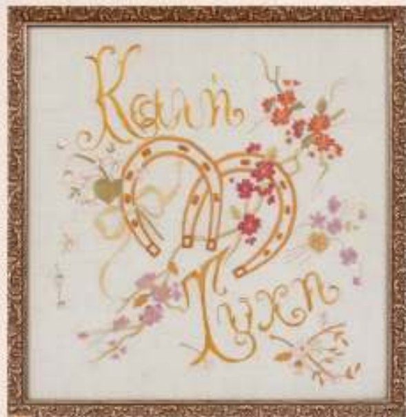
ΚΕΝΤΗΜΑ ΜΕ ΤΗΝ ΕΠΙΓΡΑΦΗ «ΚΑΛΗ ΤΥΧΗ», έργο της Ιουλίας Λεμονοφίδου από την ενορία Αγίου Ανδρονίκου. (Συλλογή Πανίκκου και Σπυρούλας Κληρίδη)