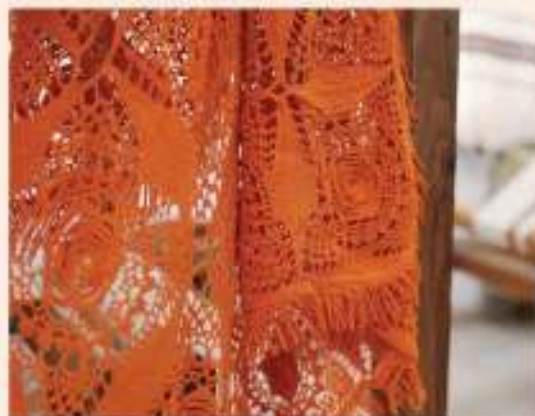
ΠΑΠΛΟΜΑ ΜΕ ΣΜΙΛΙ, έργο Ιουλίας και Γεωργίας Αρτεμίου από την ενορία Αγίας Μαρίας.