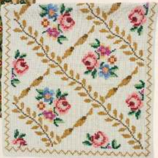
ΣΕΜΕΝ ΜΕ ΑΡΑΙΟΣΤΑΥΡΟΒΕΛΟΝΙΑ, έργο της Ρήσας Ροδαύλη-Ζαβρού από την ενορία Χρυσίδας (1965).