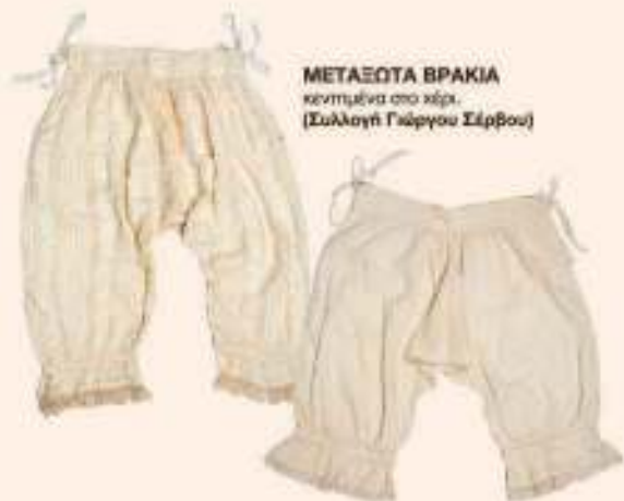
ΜΕΤΑΞΟΤΑ ΒΡΑΚΙΑ κεντημένα στο χέρι. (Συλλογή Γεώργιου Σίρβου)