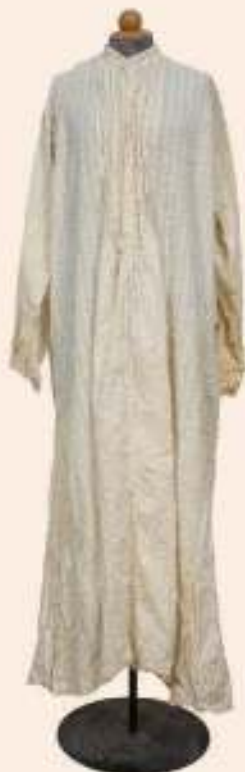
ΓΥΝΑΙΚΕΙΑ ΚΑΙ ΑΝΤΡΙΚΗ ΜΕΤΑΞΩΤΗ ΝΥΧΤΙΚΙΑ (Συλλογή Γιώργου Σέρβου)